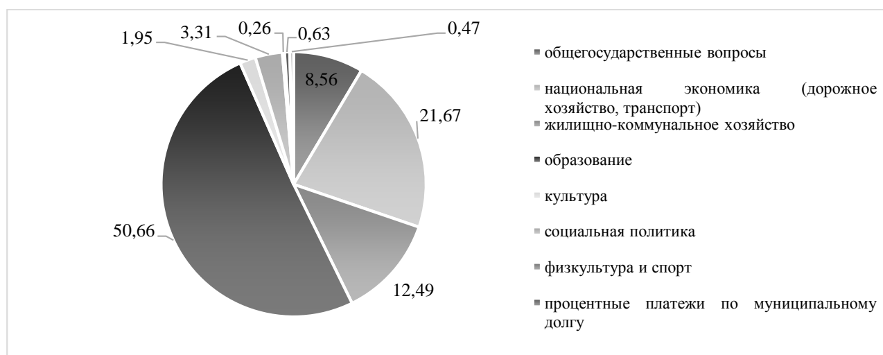
Рис. 4 – Состав расходов бюджета г. Орла в 2022 году

Графическое представление расходов бюджета г. Орла за 2022 г. представлено на рис. 4.