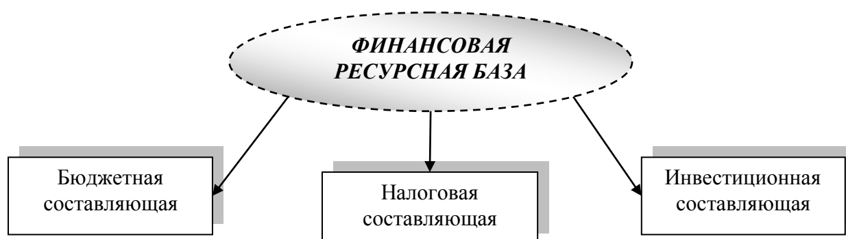
Рис. 1 - Финансовая ресурсная база муниципального образования

Структуру, составляющую ресурсную базу развития города Орла, можно представить в виде схемы, представленной на рис. 1.