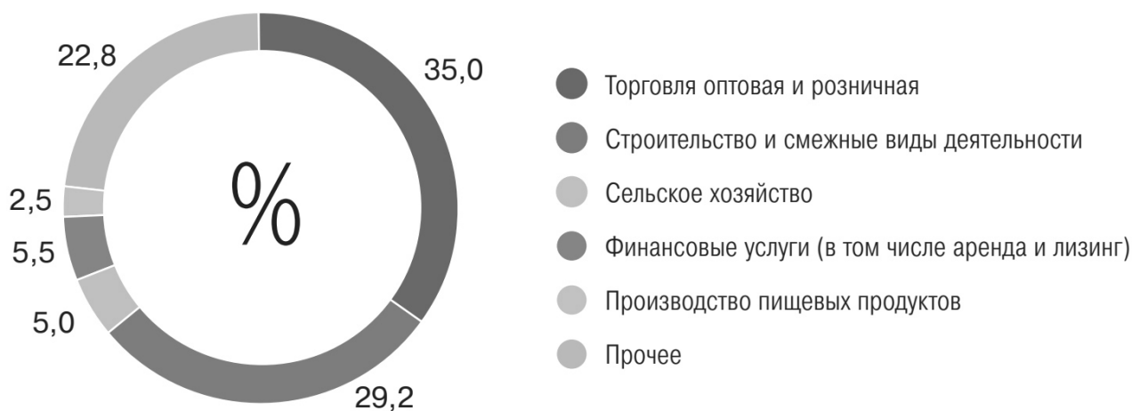
Рис. 2. – Распределение объема кредитов, предоставленных субъектам МСП, по отраслям

В целом активность кредитования субъектов МСП показывает высокие результаты. Выданные кредиты растут не только в объемах, но и в количестве. За 2022 год число заключенных кредитных договоров составило 53 тыс. единиц, что на 233% превышает показатели прошлого года (15,9 тыс.). В отраслевой структуре кредитов, предоставленных субъектам малого и среднего предпринимательства, наибольшая доля заемщиков сосредотачивается в таких сферах, как «Торговля оптовая и розничная» – 35,0% и «Строительство и смежные виды деятельности» – 29,2%. Общая структура распределения объема кредитов по отраслям представлена на рисунке 2.