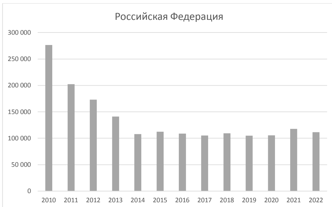
Рис.2 – Преступления экономической направленности в РФ [6]