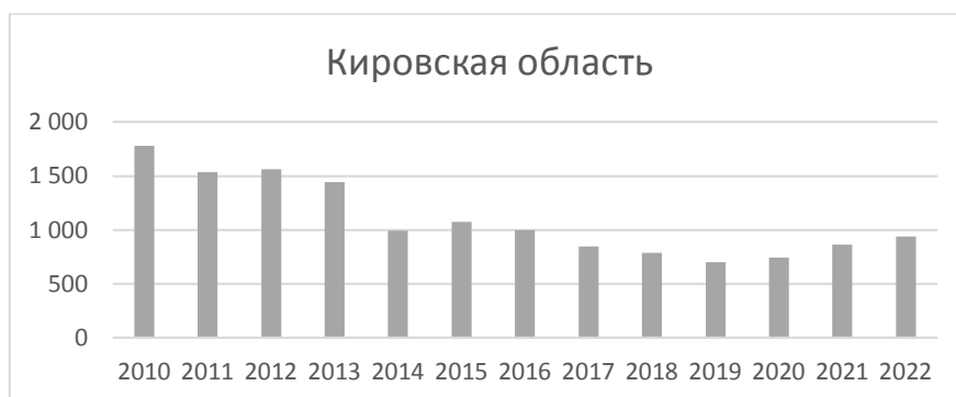
Рис.3 – Преступления экономической направленности в Кировской области [7]

Итак, доля экономических преступлений Кировской области за весь анализируемый период находится в районе 1% от общего числа нарушений в Российской Федерации.