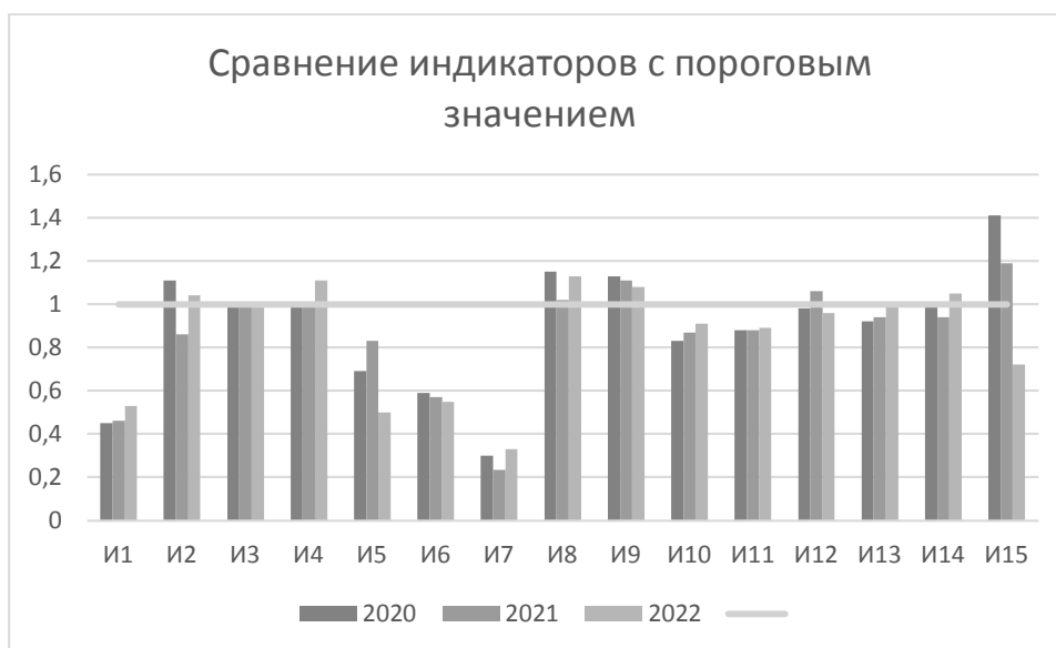
Рис.1 - Сравнение индикаторов с пороговым значением [5]

Для удобства оценки степени удаленности индикаторов от своих пороговых значений индикаторы приведем их к безразмерному виду с помощью нормировки, а именно сравнение с пороговым значением. (рис. 1).