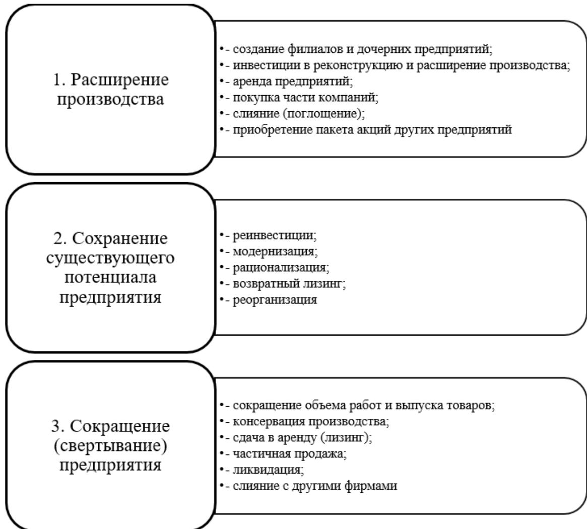
Рисунок 3 - Виды стратегий в обеспечении экономической безопасности строительного предприятия [6]

На практике чаще характерно то, что для небольших и развивающихся строительных предприятий характерна стратегия первого типа, а для крупных, соответственно, второго.