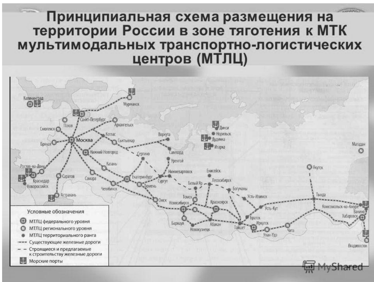
Рисунок 3- Схема логистических комплексов [5,6 ]

Выделяется федеральный уровень (Сибирь, Дальний Восток, Урал, Поволжье, Центральная Россия, Юг России, Северо-Запад России). Региональный уровень включает субъекты Российской Федерации в зависимости от территории, объемов пассажиропотоков и грузопотоков.