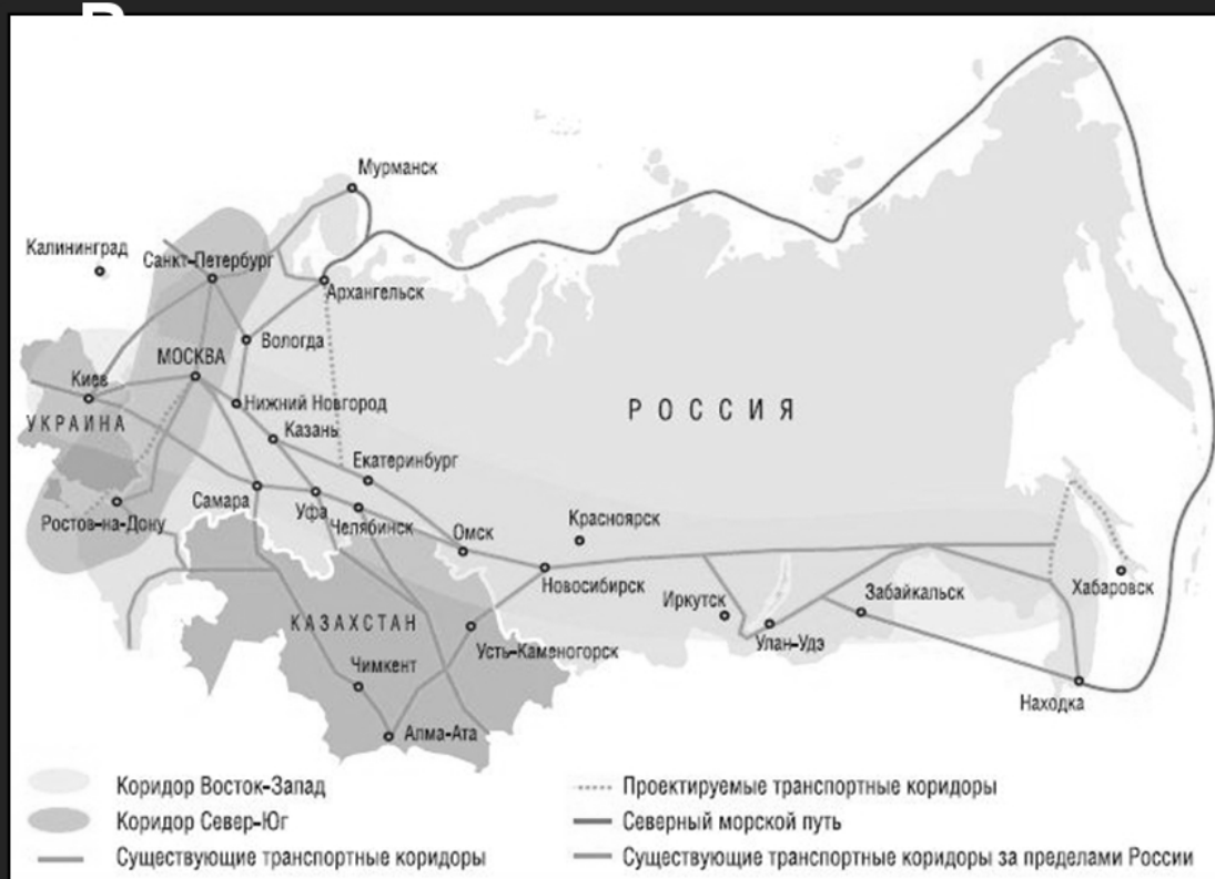
Рисунок 2 - Схема транспортных коридоров [ 3]

Восточный маршрут предназначен в большей степени несырьевых товаров в страны Азиатско-Тихоокеанского региона. «...Поставки в Иран, Ближний Восток и в Южную Азию пройдут западным маршрутом "Север-Юг", где планируется довести грузооборот до 15 миллионов тонн в год к 2030 году совместно с партнерами в Каспийском регионе».[ 4,5 Сложившаяся ситуация требует новых решений: грузы с северо-запада и юго-востока страны едут на восток. Речь идет о системе «Енисей – Северный морской путь», которая не только повысит роль водного транспорта Сибири, но и усилит логистику региона в транспортной системе России. Новая система проходит по территории Ангаро-Енисейского региона (АЕР), в котором сосредоточены 50% энергоресурсов, 65% запасов угля, 80% запасов никелевых руд, 70% – медных, 90% – свинцовых, 75% – цинковых и 45%