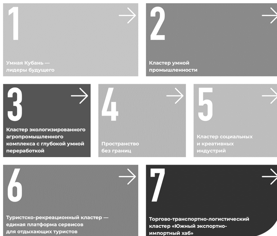
Рис. 2 – Приоритетные направления привлечения инвестиций в экономику Краснодарского края (составлено авторами)

Парламент Кубани в течение 2020 г. дважды вносил поправки в закон «О налоге на имущество организаций». «Их цель – содействие модернизации жилых комплексов в рамках реализации локальных инвестиционных проектов (РИП). Второй региональный закон снижает ставку налога на прибыль организаций-членов РИП, инвестируя в создание новых организаций, а также в расширение и развитие существующего производства в регионе».