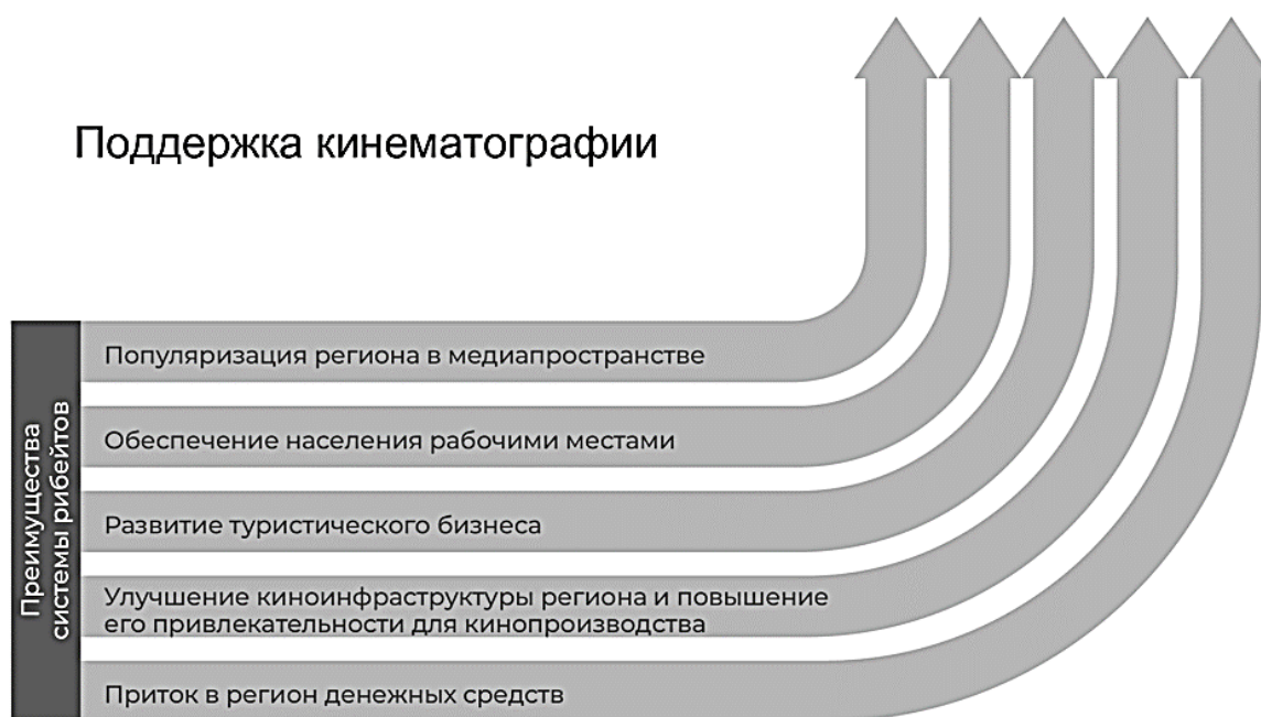
Рис. 3 – Преимущества государственной поддержки кинематографии на региональном уровне (визуализировано авторами по данным инвестиционного портала Краснодарского края)

края» [9]. В 2021 г. и в 2022 г. поддержка кинематографии составила 20 млн руб. и 50 млн. руб. соответственно. Основные преимущества такой поддержки изображены на рисунке 3.