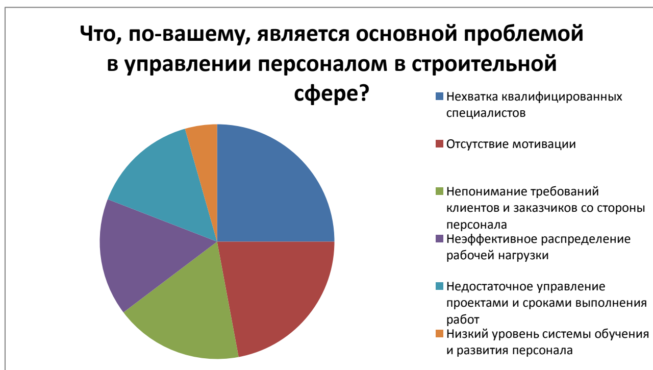
Рисунок 1 – Диаграмма результатов опроса сотрудников строительной компании

информацию о том, как происходит управление персоналом на практике. В ходе анализа документов были изучены положения о заработной плате и отчёты о выполняемой работе, которые позволили получить представление о деятельности компании и выявить проблемы в управлении персоналом. Опрос сотрудников был проведен с помощью анкетирования, в котором от сотрудников требовалось указать основные проблемы, которые по их мнению присутствуют в управлении персоналом в строительной отрасли. Результаты анкетирования показали, что из 68 опрошенных сотрудников 17 считают основной проблемой нехватку квалифицированных специалистов, 15 – недостаточную мотивацию сотрудников, 12 - непонимание требований клиентов и заказчиков со стороны персонала, 11 - неэффективное распределение рабочей нагрузки, 10 - недостаточное управление проектами и сроками выполнения работ и 3 – низкий уровень системы обучения и развития персонала (рис. 1).