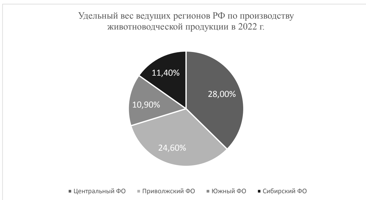
Рисунок 3 – Удельный вес ведущих регионов РФ по производству животноводческой продукции в 2022 г.

Далее представлены показатели объемов реализации сельхоз продукции (табл. 4).