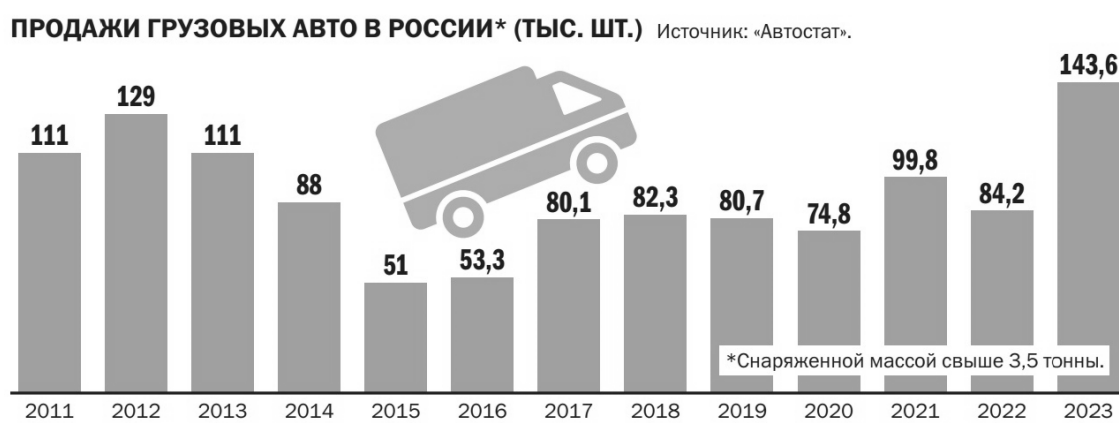
Рисунок 5 – Продажи грузового транспорта за 13 лет в России(тыс.шт.).[ 5]

Из-за высоких продаж 2023 года рынок продаж грузового транспорта перенасытился техникой. На рисунке 5 можно увидеть, что с 2017 по 2022 год продажи грузового транспорта составляли в среднем 83,65 тыс. шт. В 2023 году рынок превысил среднее количество продаж на 59,95 тыс. шт. Исходя из полученных данных можно сказать, что рынок в 2023 году достиг своего пика и в последующие годы рынок грузовой техники будет сжиматься.