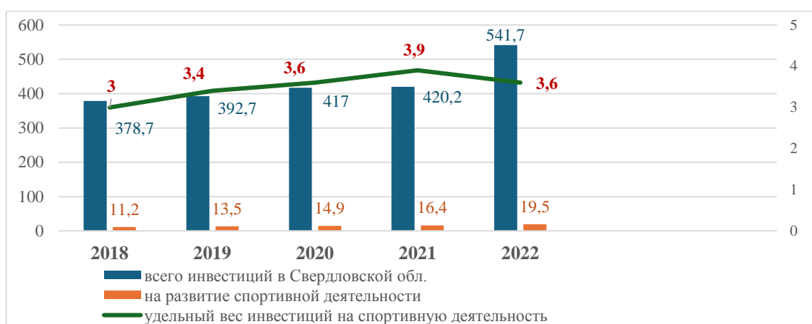
Рисунок 3. Объём инвестиций на развитие спортивной деятельности в Свердловской области, млрд. рублей [8; 20]

Проанализируем показатели инвестиций на развитие спортивной деятельности за период исследования (рис. 3).