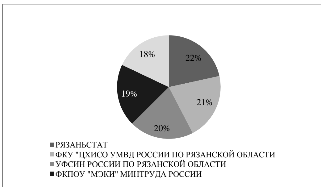
Рис.3 – Количество закупок Рязанской области по числу проверок минимальной цены за все время [3]

В Рязанской области структура заказчиков более диверсифицирована: среди них лидерами выступают учреждения УФСИН, статистическая служба (Рязаньстат) и образовательное учреждение (МЭКИ), что демонстрирует более широкий отраслевой охват закупок. Рязанская область является регионом с меньшими объемами закупок, но также обладает разнообразной отраслевой структурой закупочного процесса.