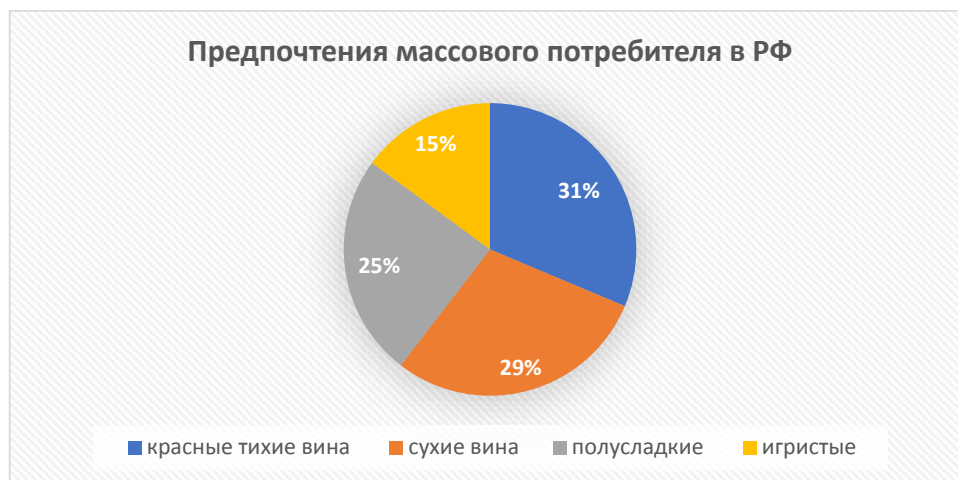
Рисунок 3 – Предпочтения в выбор вина массового потребителя в РФ, Источник: составлено автором по источнику [3]

Этот сегмент обладает высокой ценовой чувствительностью и менее выраженной ориентацией на происхождение и стиль вина.