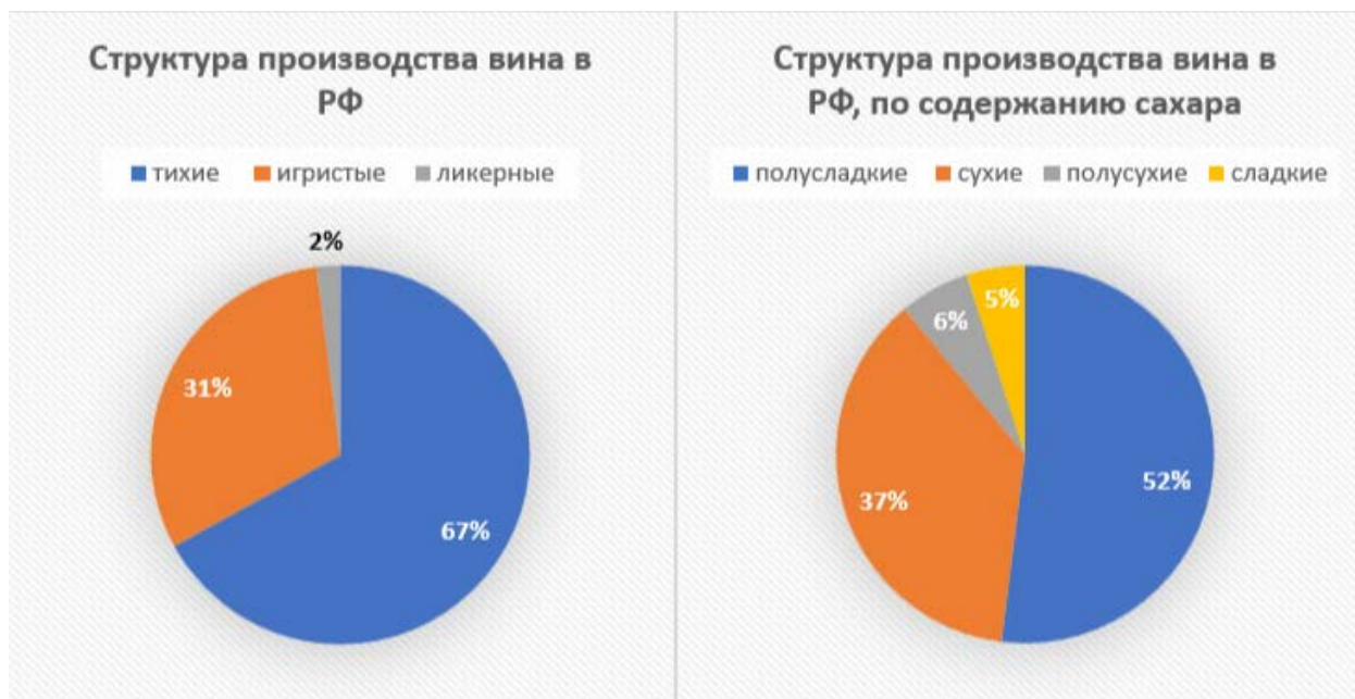
Рисунок 2 – Структура производства вина в РФ на 2024 г.

производства [10]. Структура производства вина в РФ представлена на рисунке 2.