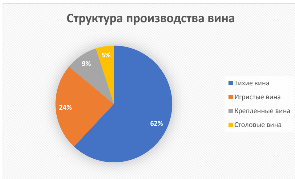
Рисунок 5 – Структура производства вина в Севастополе,