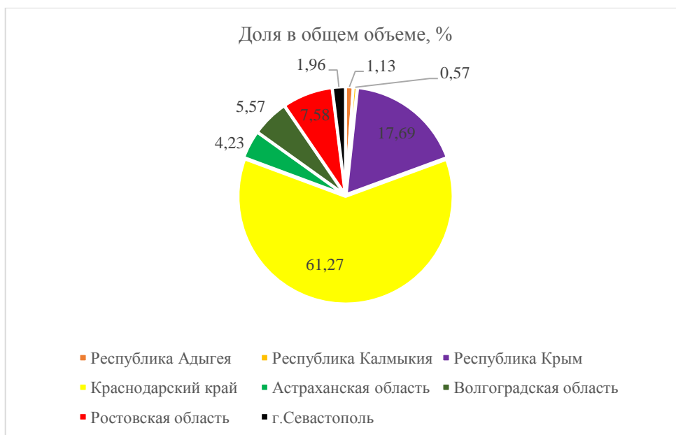
Рис. 2 – Доли количества гостиниц в общем объеме, %

На рисунке 2 видно, что наибольшую долю в общем количестве коллективных средств размещения в ЮФО занимает Краснодарский край (61,27%), Республика Крым (17,69%) и Ростовская область (7,58%).