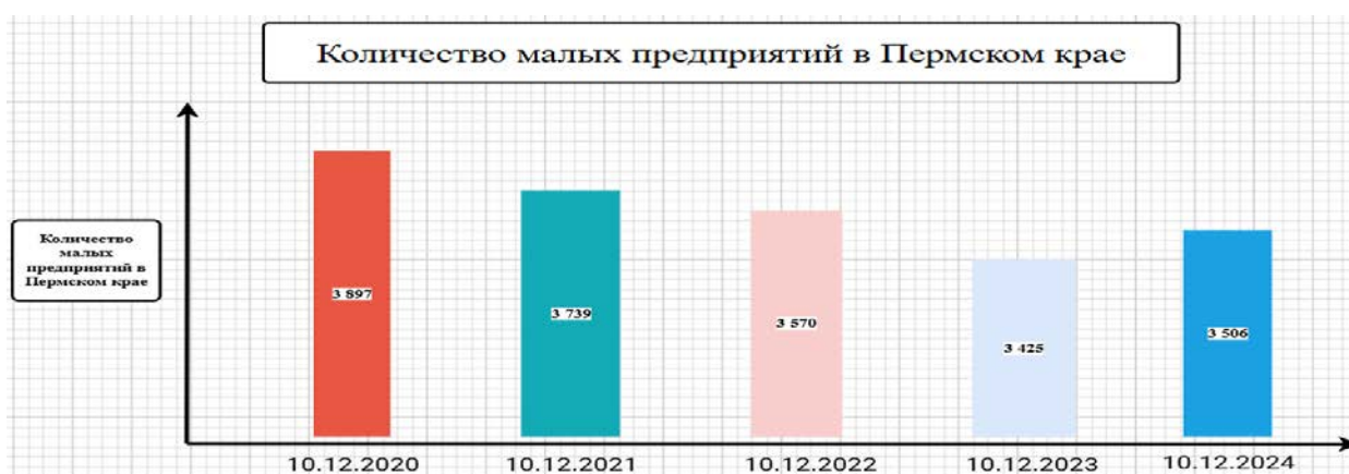
Рис. 4 - Количество малых предприятий в Пермском крае

Однако перед сектором стоят серьёзные вызовы: сокращение работников и юридических лиц. Государственная поддержка в виде программ финансирования и субсидий остается критически важной, но ее эффективность напрямую зависит от того, насколько точно меры соответствуют реальным потребностям предпринимателей и специфике местного рынка. Поэтому оценка результативности такой поддержки является актуальной задачей для обеспечения устойчивого развития региона и повышения благосостояния его жителей.