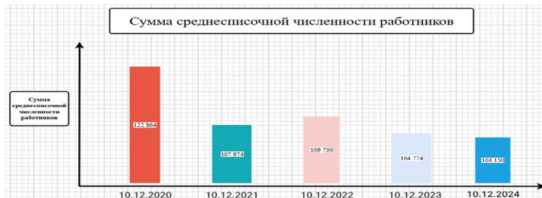
Рис. 5 - Сумма среднесписочной численности работников

площадкой для стартапов, внедряющих инновационные идеи и технологии. Это не только способствует созданию новых рабочих мест, но и повышает конкурентоспособность региона на фоне других экономических округов.