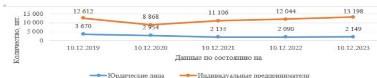
Рис. 3 - Динамика количества «вновь созданных» субъектов малого предпринимательства в Пермском крае, 2019-2023 гг

Рассматривая данные о вновь созданных субъектах малого предпринимательства, выделяются противоположные тенденции для разных организационных форм. Число новых юридических лиц за анализируемый период сократилось на 41%, тогда как количество зарегистрированных индивидуальных предпринимателей, напротив, возросло на 4,6%. Эта ситуация развивается параллельно с общим сокращением занятости в секторе. При этом снижение среднесписочной численности работников особенно заметно на предприятиях, являющихся юридическими лицами.