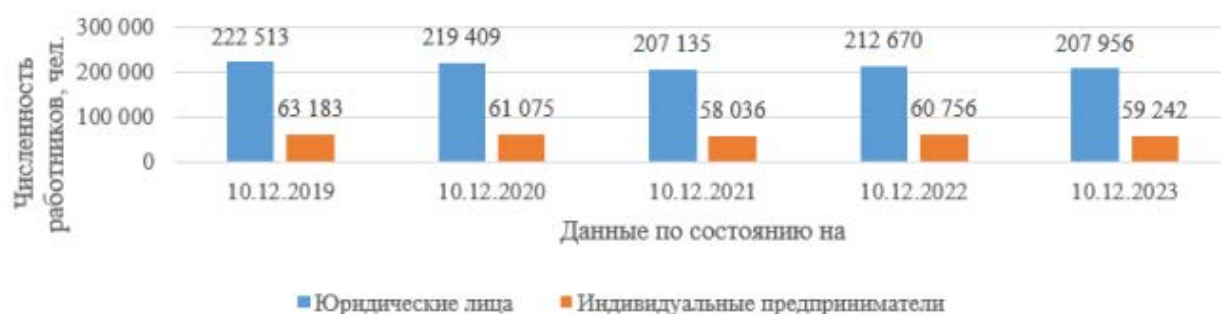
Рис. 2 - Динамика суммы среднесписочной численности работников субъектов малого предпринимательства в Пермском крае, 2019-2023 гг. 1

сегменте юридических лиц занятость уменьшилась на 6,54%, а у индивидуальных предпринимателей — на 6,24%. Сокращение занятости, сопровождающее структурные изменения в секторе, может указывать на общие вызовы, связанные с масштабированием деятельности и созданием новых рабочих мест в регионе.