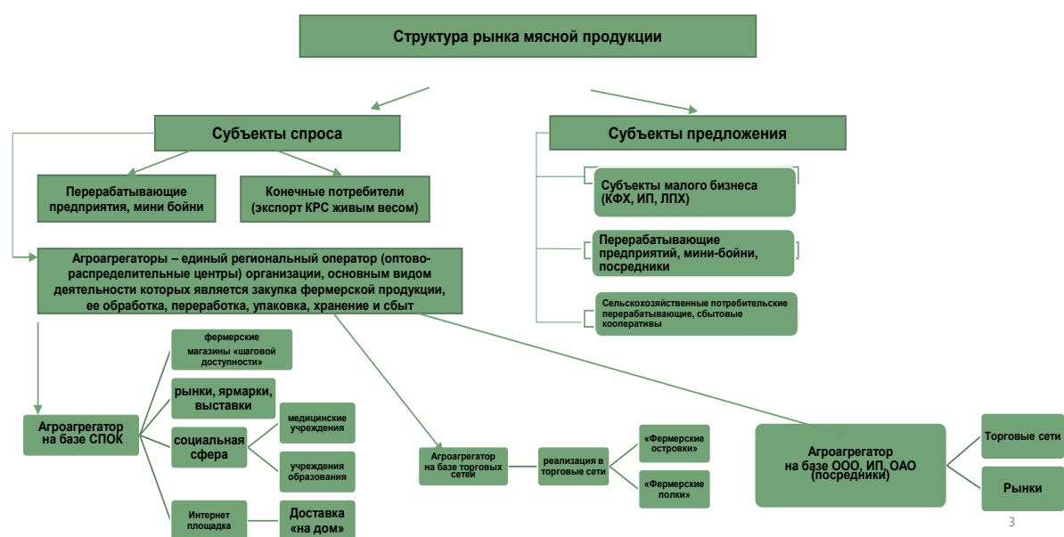
Рисунок 2 - Структура рынка мясной продукции[4]

Инфраструктуры рынка фермерской мясной продукции представлена на рисунке 2.