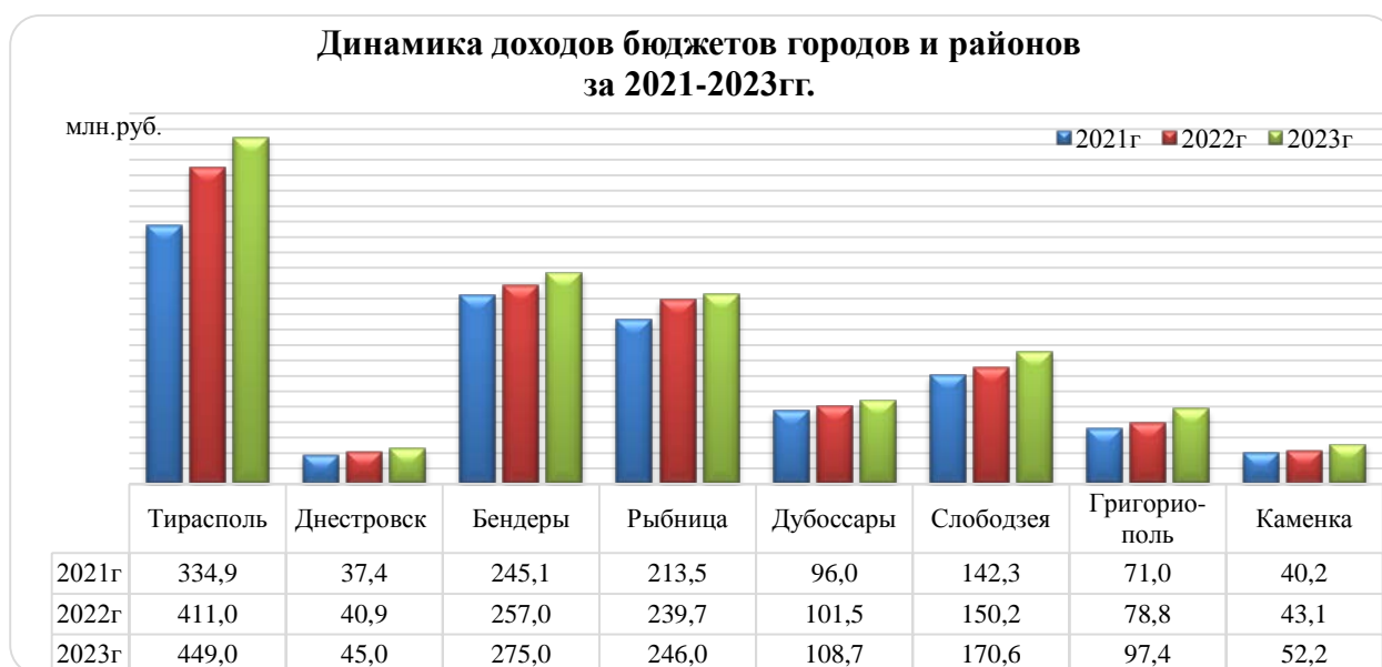
Рисунок 2 – Динамика доходов местных бюджетов за 2021-2023гг., млн руб.

Динамика доходов местных бюджетов городов и районов за 2021-2023 годы приведена на рисунке 2 [2].