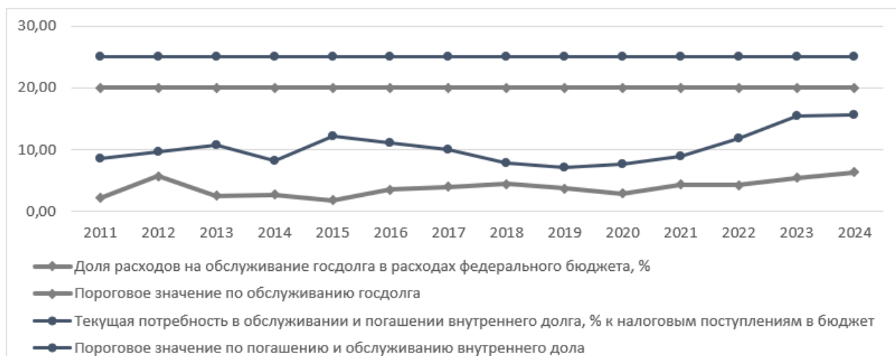
Рис. 2 – Динамика показателей способности обслуживания внутреннего и внешнего государственного долга РФ

относительно невысокую долю – до 2021 года не более 4,5% (при максимально допустимом уровне 20%). Однако с 2022 года наблюдается их рост до 6,35% в 2024 году.