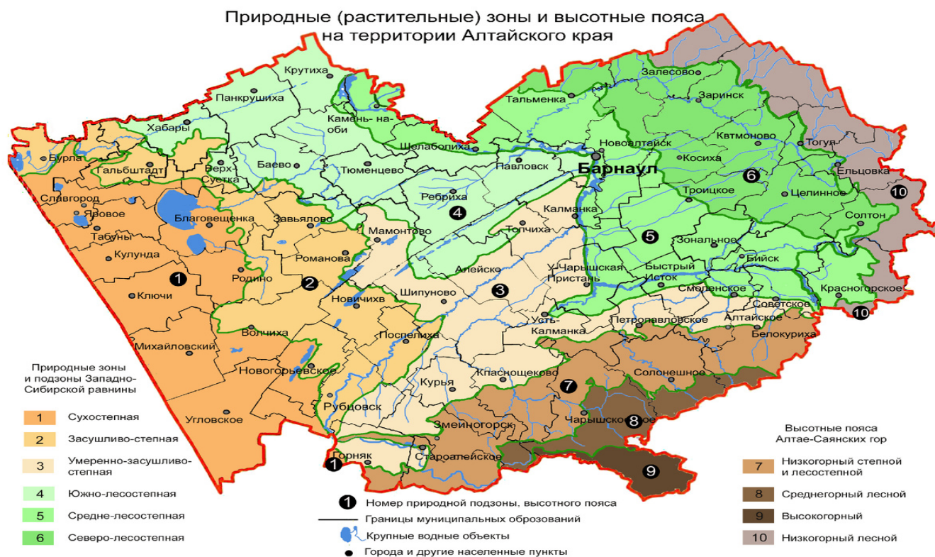
Рисунок 1- Природные зоны Алтайского края [2]

При этом край из преобладания сельского населения преобразовался в регион, с преобладанием городского населения. Городское население составляет более 59% при средней плотности населения 12,50 чел./км 2 , что рассматривается, как низкая плотность, которая характерна для большинства регионов Сибири.[2]. (рис.2)