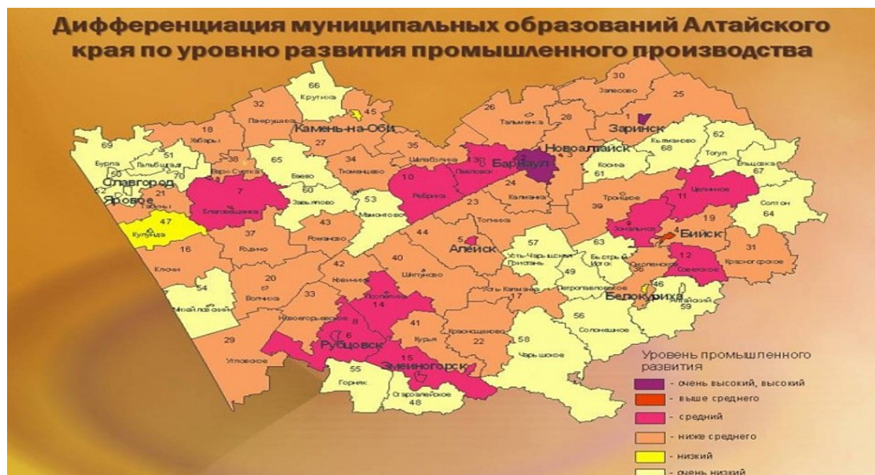
Рисунок 4. – Дифференциация муниципальных образований Алтайского края по уровню развития промышленного производства[4]

Специализация Алтайского края имеет несколько основных направлений: