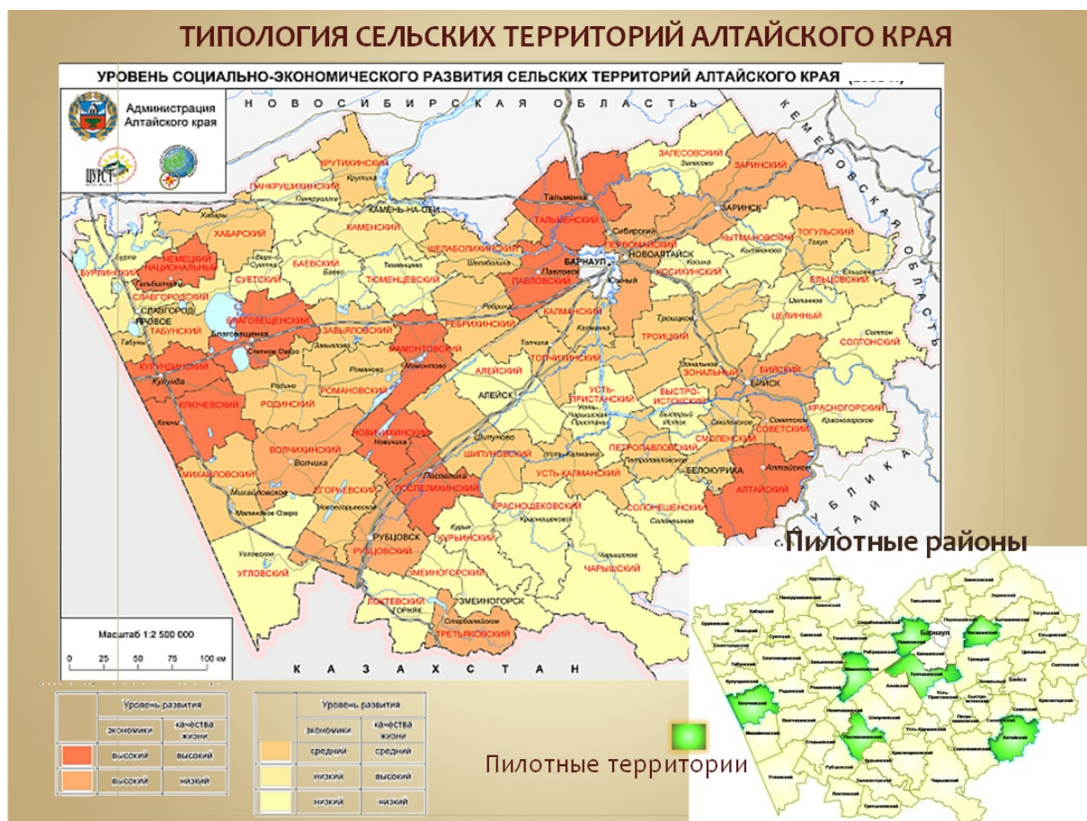
Рисунок 3. -Уровень социально-экономического развития территорий Алтайского края[3]

Развитие пилотных проектов сосредоточено в районах с различным уровнем социально-экономических показателей, что объясняется отраслевой принадлежностью проектов и наличием ресурсно-сырьевой базы.