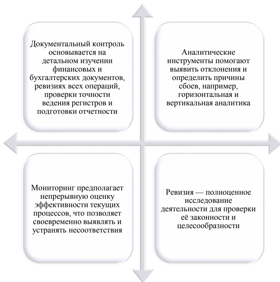
Рис.1. Методы финансового контроля [1]

финансовой системе выделяют несколько ключевых принципов. На практике принципы включают разделение обязанностей, что способствует минимизации рисков мошенничества и ошибок. Примером служит отдельное обслуживание базы данных поставщика и аналитика изменений в ней, а также ограничения доступа в базы данных [2]. К примеру, бухгалтер по материальным запасам имеет доступ только к информации о задолженности. Выделим немаловажный аспект в исследуемой теме, это методы реализации финансового контроля. Для наглядного исследования обозначим их в виде рисунка 1. Методы финансового контроля и кратко охарактеризуем их.